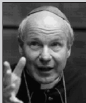
Kardinál Christoph Schönborn