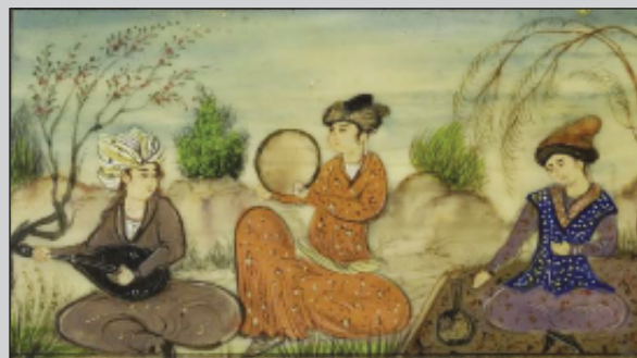
Perská miniatura (Museum Humanum)

J. Ch. Bürgel, narozen 1931, je bývalý profesor islámských věd bernské univerzity. Za jeho překlady obdržel mj. cenu Friedricha Rückerta od města Schweinfurtu a cenu pro překladatele města Bernu.