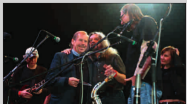
Plastic People of the Universe (s V. Havlem)