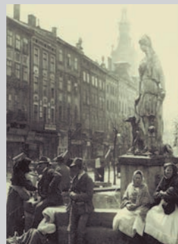
Lemberg um 1900