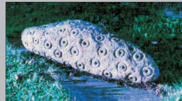
Franz Xaver Ölzant

energie: spočítal, že momentální celosvětová spotřeba energie 13 Terawatt odpovídá lidskému výkonu o 130 mil „lidské síly“ (po 100 W). H.-P. Dürr je nositelem Alternativní Nobelovy ceny. Společně s vědeckokritickou nezinárodní skupinou Pugwash obdržel Dürr 1995 Nobelovu cenu za mír.