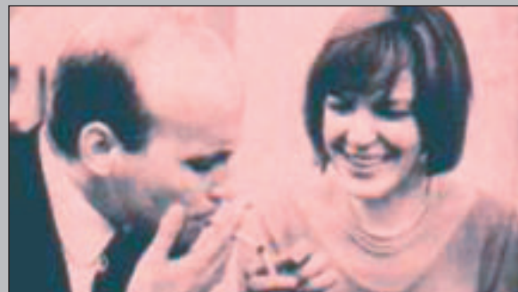
Hans Werner Henze, Ingeborg Bachmann