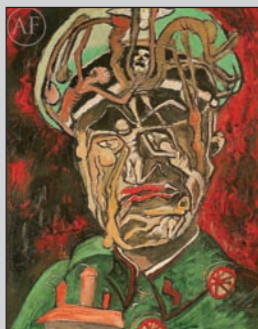
Umělec: Adolf Frankl