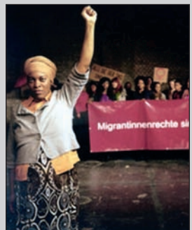
práva migrantek = práva žen